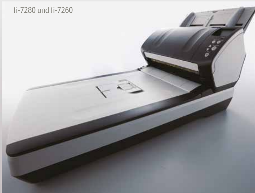
fi-7280 und fi-7260

Trägerfolien Trägerfolien ermöglichen das Scannen von Dokumenten größer als A4, oder von Fotos und empfindlichem Beleggut. {Artikelnummer – PA03360-0013}