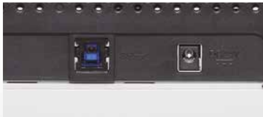
Hohe Geschwindigkeit über USB 3.0 Schnittstelle