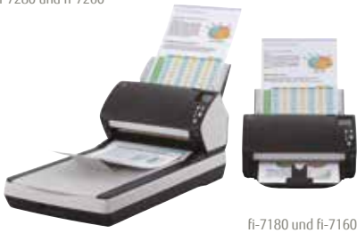
fi-7180 und fi-7160

fi-7160/fi-7260 – A4-Hochformat mit 300 dpi: 60 Seiten/min bzw. 120 Bilder/min Scannen von gemischten Stapeln bis zu 80 Blatt